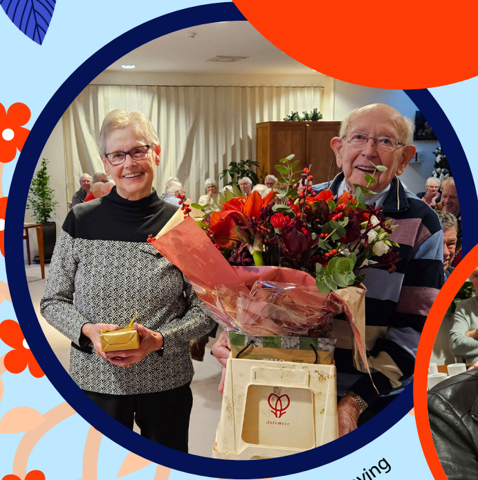
Mw en hr. Hoving