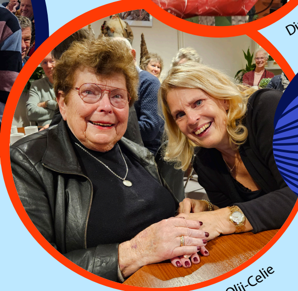
Moeder en dochter Olij-Celie