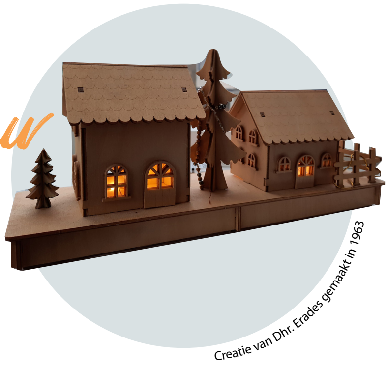
Creatie van Dhr. Erades gemaakt in 1963

Tekst en afbeeldingen: Wilma Groenenberg