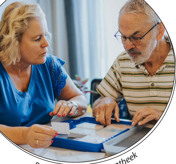
Producten uit de Dementheek