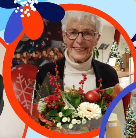
Tini Man Oly