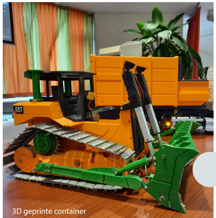
3D geprinte container